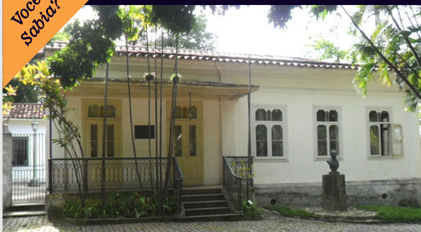
Fachada do Museu Casa de Benjamin Constant, em Santa Teresa

Você sabia que, após passar 6 anos fechado para reformas, o Museu Casa de Benjamin Constant , situado em Santa Teresa, reabriu? Nele é mostrada a trajetória de Benjamin Constant e sua participação na proclamação da nossa república, além da história familiar cotidiana do período, apresentando as transformações ocorridas no ambiente doméstico entre os séculos XIX e XX. A obra, de um pouco mais de 7 milhões de reais, abrangeu dois prédios históricos: a casa onde viveu Benjamin Constant, que hoje abriga o museu, e a construção onde residiu a filha do militar e professor, atualmente a sede administrativa.