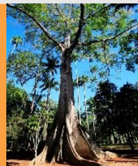
Mogno africano e sumaúma presentes na trilha das árvores gigantes

O Jardim Botânico do Rio inaugurou A trilha das árvores gigantes . A proposta é apresentar as maiores árvores do Jardim Botânico. O novo percurso, lançado pela instituição em homenagem ao Dia da Árvore (21/09), destaca as dez árvores com maior altura da coleção do arboreto, sendo a mais alta de todas o mogno africano ( Khaya senegalensis ), com 49,1 metros – o equivalente a um prédio de 16 andares. As visitas guiadas acontecem às 10h e às 14h, e a atividade é gratuita, mas há cobrança de ingresso para entrada no arboreto. Os interessados devem fazer a inscrição prévia pelos telefones (21) 3874-1808/(21) 3874-1214 ou pelo e-mail cvis@jbrj.gov.br . Já os ingressos podem ser comprados na bilheteria ou pelo site jbrj.eleventickets.com . Outras informações sobre as árvores e sobre a trilha podem ser obtidas pelo aplicativo do Jardim Botânico do Rio de Janeiro.